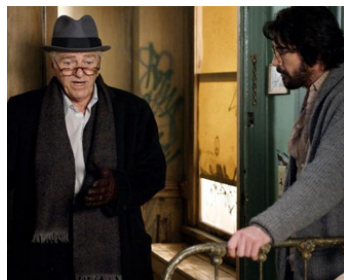
2006 LES LOCATAIRES (The Tenants) de Danny Gree avec Dylan McDermott