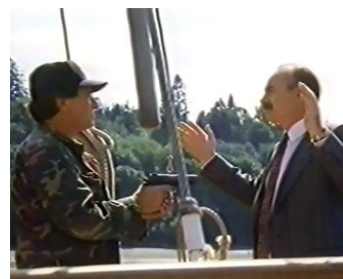
1992 TROIS KIDS ET UN TUEUR (Adventures in Spying) d'Hil Covington avec G. Gordon Liddy