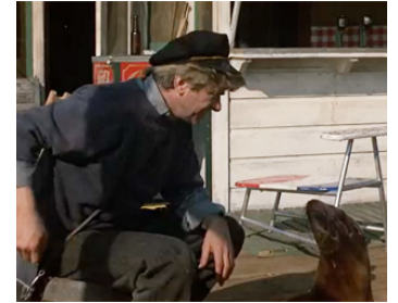
1976 LE DERNIER NABAB (The last Tycoon) d'Elia Kazan