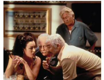
2000 THE CREW (The Crew) de Michael Dinner avec Jennifer Tilly, R. Dreyfuss, Burt Reynolds