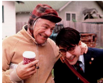
1998 RUSHMORE (Rushmore) de Wes Anderson avec Jason Schwartzman