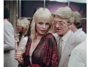
1981 LE ROI DE LA MONTAGNE (King of the Mountain) de Noel Nosseck avec Lillian Muller