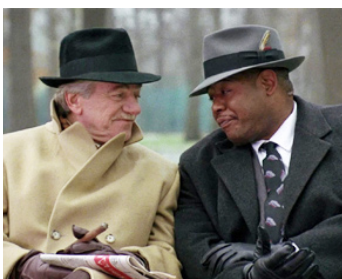
1991 HIT MAN, UN TUEUR (Diary of a Hitman) de Roy London avec Forest Whitaker