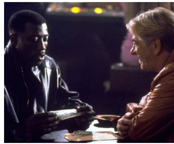
1993 L'EXTRÊME LIMITE (Boiling Point) de James B. Harris avec Wesley Snipes