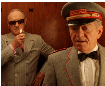
2001 LA FAMILLE TENENBAUM (The Royal Tenenbaums) de Wes Anderson avec G. Hackman