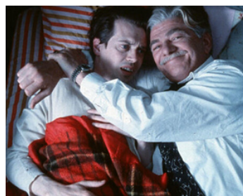
1992 IN THE SOUP (In the Soup) d'Alexandre Rockwell avec Steve Buscemi