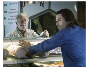
2009 LITTLE NEW YORK (STATEN ISLAND) de James DeMonaco avec Ethan Hawke