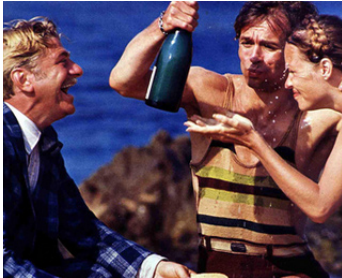
1977 VALENTINO (Valentino) de Ken Russell avec Rudolf Nureev, Michelle Phillips