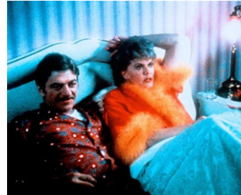
1980 UN ANGE SUR LE DOS (Angel on my Shoulder) de John Berry avec Barbara Hershey