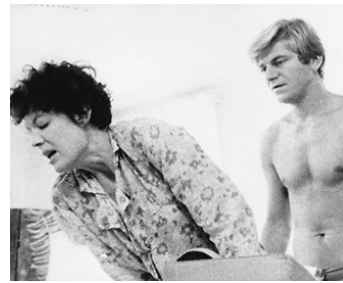
1968 FACES (Faces) de John Cassavetes avec Lynn Carlin