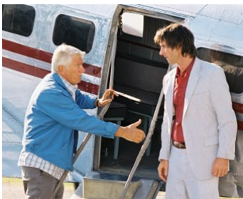
2005 THE WENDELL BAKER STORY d'Andrew et Luke Wilson avec Luke Wilson