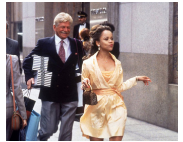
1994 MILLIARDAIRE MALGRÉ LUI (It could happen to you) d'A. Bergman avec Rosie Perez