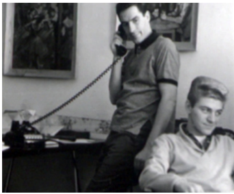
1959 SHADOWS (Shadows) de John Cassavetes avec John Cassavetes