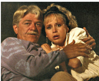
1987 SURVIVAL GAME (Survival Game) d'Herb Freed avec Deborah Goodrich