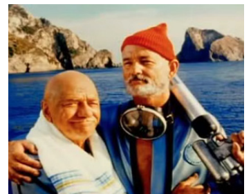
2004 LA VIE AQUATIQUE (The Life Aquatic with Steve Zissou) de Wes Anderson avec B. Murray