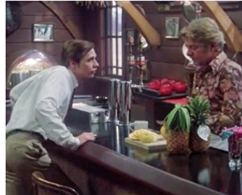
1979 ÇA GLISSE... LES FILLES (California Dreaming) de John D. Hancock avec Dennis Christopher