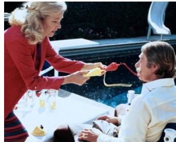
1984 LOVE STREAMS (Love Streams) de John Cassavetes avec Gena Rowlands