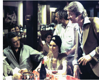
1976 MEURTRE D'UN BOOKMAKER CHINOIS de John Cassavetes avec Val Avery, E. Deering