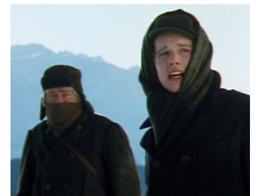
1991 CROC-BLANC (White Fang) de Randal Kleiser avec Ethan Hawke