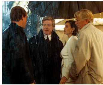
1993 PROPOSITION INDÉCENTE (Indecent Proposal) d'Adrian Lyne avec R. Redford, Demi Moore