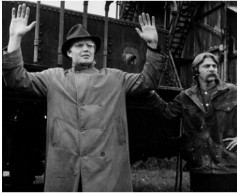
1970 LE RÉVOLUTIONNAIRE (The Revolutionary) de Paul Williams avec Jon Voight