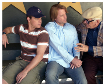
2003 DEUX EN UN (Stuck on You) de Peter & Bobby Farrelly avec M. Damon, G. Kinnear