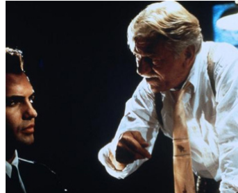
1997 LIENS SECRETS (This World, Then the Fireworks) de M. Oblowitz avec Billy Zane