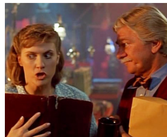
1989 MA BELLE-MÈRE EST UNE SORCIÈRE (Wicked Stepmother) de Larry Cohen avec Colleen Camp