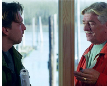
1996 DES CHOSES QUE JE NE T'AI JAMAIS DITES d'Isabel Coixet avec Andrew McCarthy