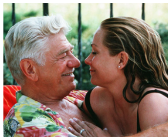
2002 PASSIONADA (Passionada) de Dan Ireland avec Theresa Russell