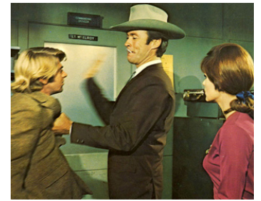
1968 UN SHÉRIF À NEW YORK (Coogan's Bluff) de Don Siegel avec C. Eastwood, Susan Clark