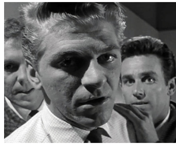
1961 LA BALLADE DES SANS-ESPOIRS (Too Late Blues) de J. Cassavetes avec R. Chambers