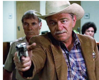
1986 L'ŒIL DU TIGRE (Eye of the Tiger) de Richard C. Sarafian