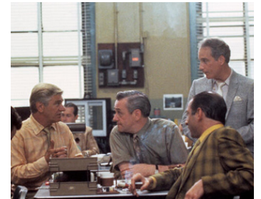
1987 LES FILOUS (Tin Men) de Barry Levinson avec John Mahoney, Richard Dreyfuss