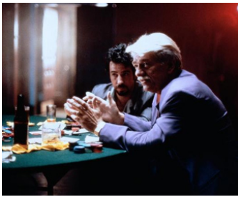
1993 UNE BELLE EMMERDEUSE (Trouble Bound) de Jeffrey Reiner avec Rustam Branaman