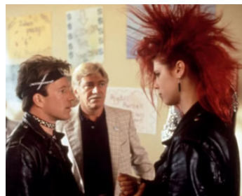
1988 PLAIN CLOTHES de Martha Coolidge avec Arliss Howard, Kimberley Pistone