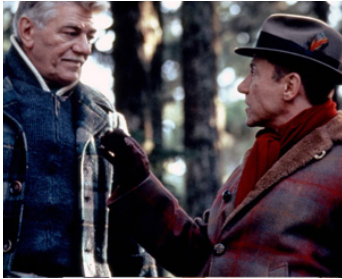
1994 LE POINT DE RUPTURE (Imaginary Crimes) d'Anthony Drazan avec Harvey Keitel