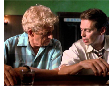
1996 TREES LOUNGE (Trees Lounge) de Steve Buscemi avec Steve Buscemi